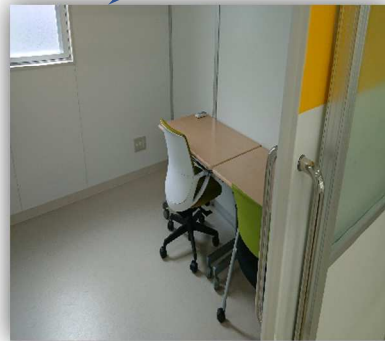
↑ここは少人数ブース