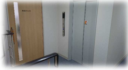
↑エレベーターで移動できます