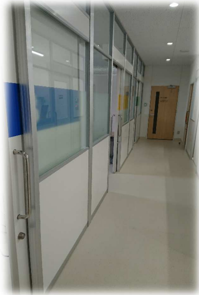
↑こんな風に4ブース並んでいます